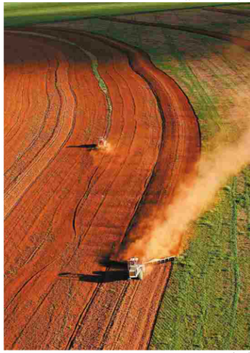
Terra de lavoura na região de Campo Novo do Parecis (MT)

O CPI é uma rede de pesquisadores de vários países que se debruçam sobre temas como políticas relevantes para energia e uso da terra.